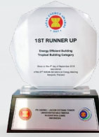
GEDUNG P.K OJONG - JAKOB OETAMA TOWER 1 st Runner Up Energy Efficient Building Asean Energy Award 2019